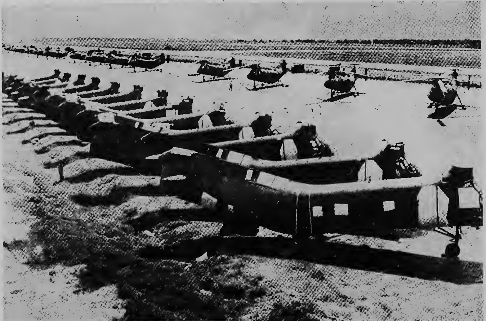
Riba e aeropuerto militar Tan Son Nhut na Saigon un cantidad di helicopter H 21 ta para cla. E helicopternan aki cu tabata hopi

Segun e vocero relaciona e fecha cu e gobierno Griego lo stipula lo no cai huntu cu e bishita, cu e prome minister Turco Inonu lo haci venidero fin di siman na president Johnson.